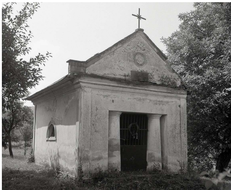
Zemepánska hrobka v Gregorovciach