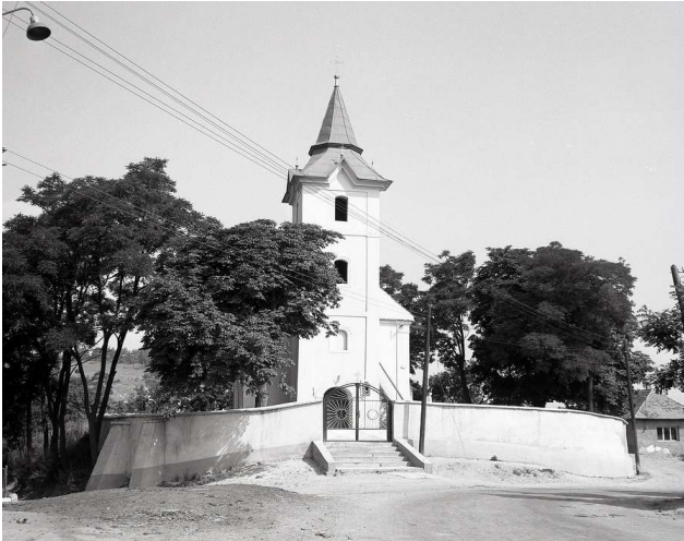
Rímskokatolícky kostol Narodenia Panny Márie v Gregorovciach