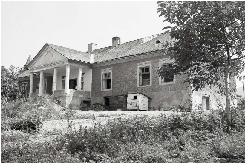
Kúria v Gregorovciach