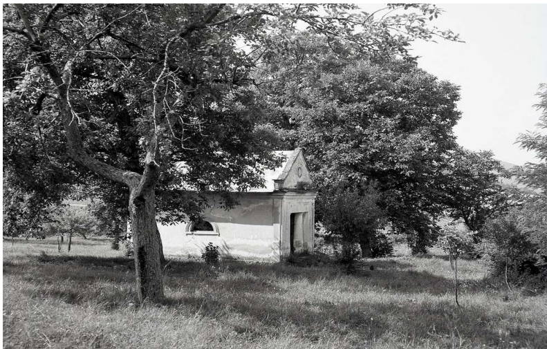
Hrobka v pánskej záhrade