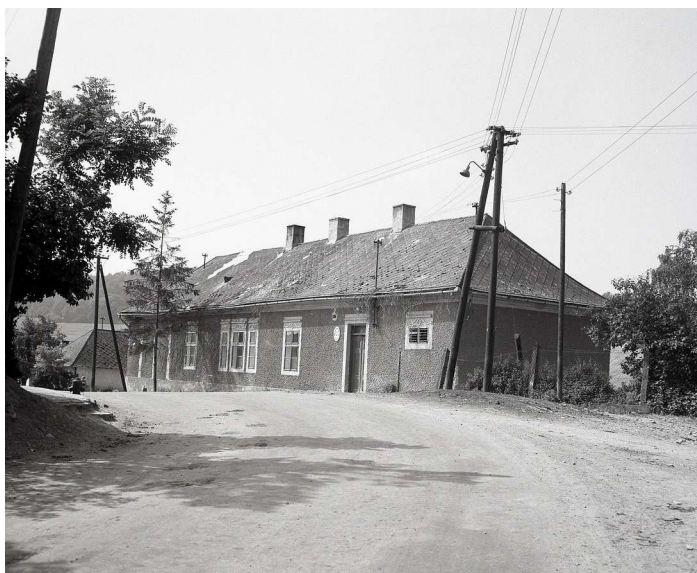
Kúria, neskôr Miestny národný výbor Gregorovce