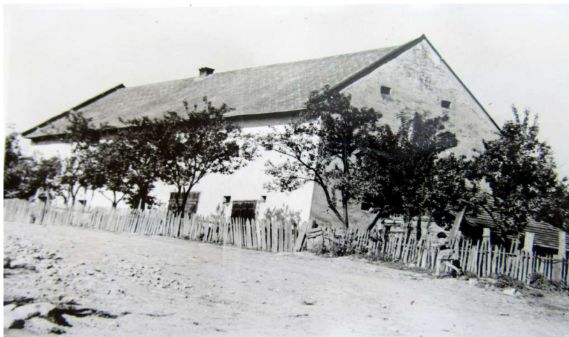
Sýpka veľkostatkára Lampatera