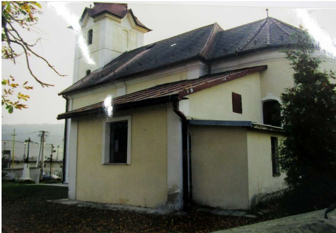
Rímskokatolícky kostol Narodenia Panny Márie v Gregorovciach