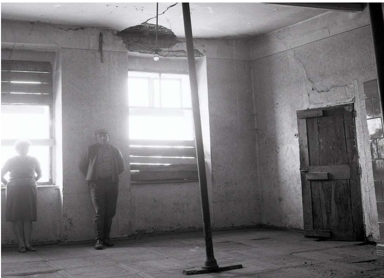
Kúria v Gregorovciach, interiér