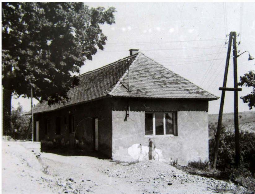
Osvetová miestnosť, provízorne priestory materskej škôlky