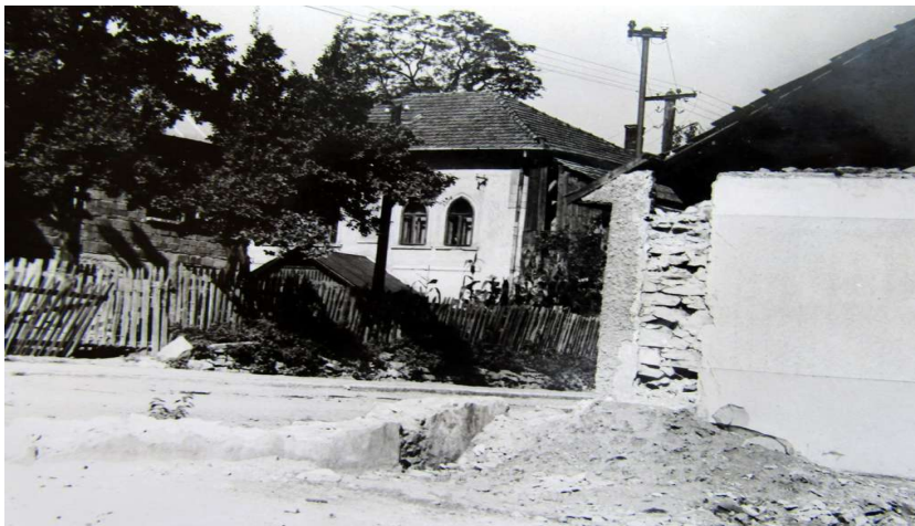
Kaštieľ v Gregorovciach